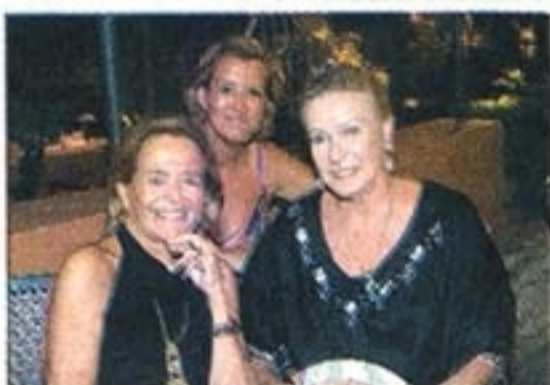
Maria Gabriela de Saboya y amigas