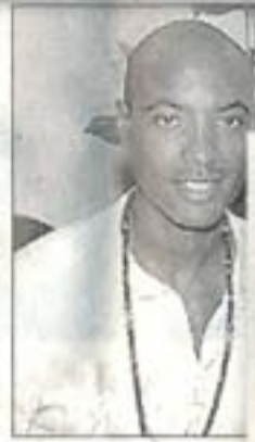
Kiera Chaplin c

Alessandra Ambrosio cenó con amigos de NY en L'Elephant