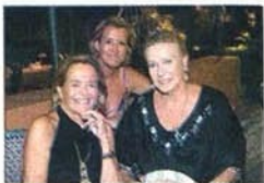
Maria Gabriela de Saboya y amigas