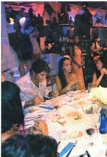
Ibicencos, residentes, vips y personajes variopintos se reúnen en

Los personajes del papel couché coinciden las noches de verano en los restaurantes de la isla